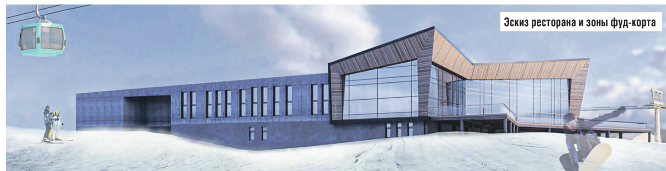
Эскиз ресторана и зоны фуд-корта

При сооружении объектов инфраструктуры будут стараться минимально воздействовать на природу и рельеф.