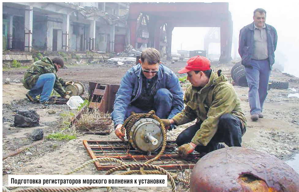
Подготовка регистраторов морского волнения к установке

Финальная экспозиция будет представлена в канун празднования 140-летия города и вновь пройдет под слоганом «Владимировка – Тоёхара – Южно-Сахалинск». Как получится, предугадать сложно, но будем стараться.